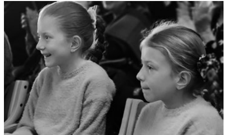
Junge und Jüngste gefesselt von der Musik