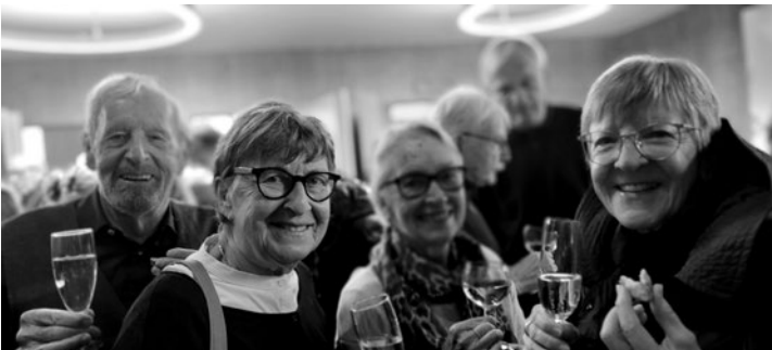
Seit Jahren Üdike verbunden