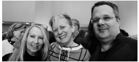
Dank an den Vorstand der ref. Kirchgemeinde für den Apéro