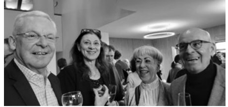
Gemeinderätin mit Tochter und Gemeindepräsident mit Üdikern